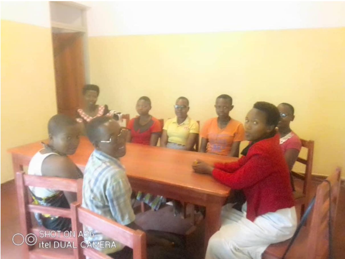
Hier zijn ze in hun eigen kleding gezellig aan het praten in hun vrije tijd.