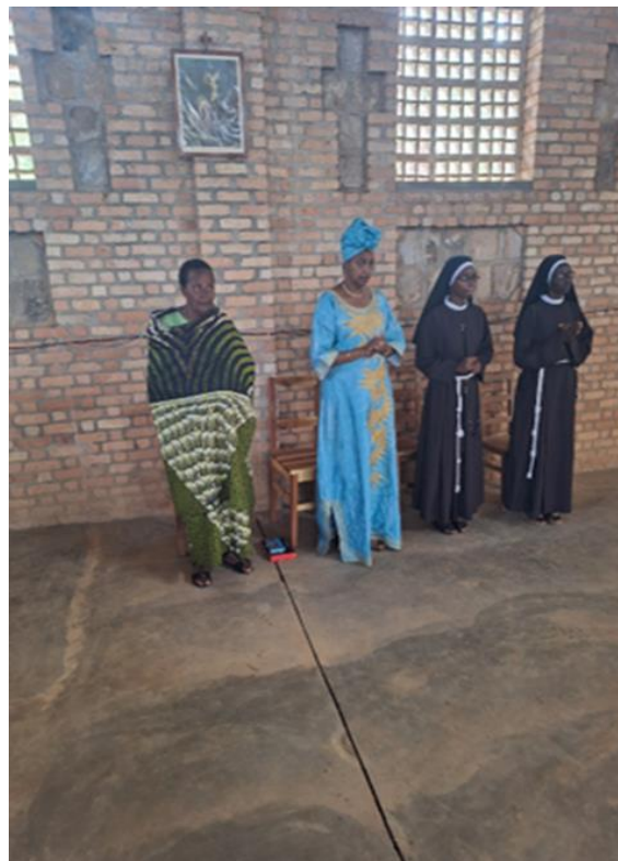
Samen met de zusters in de kerk.