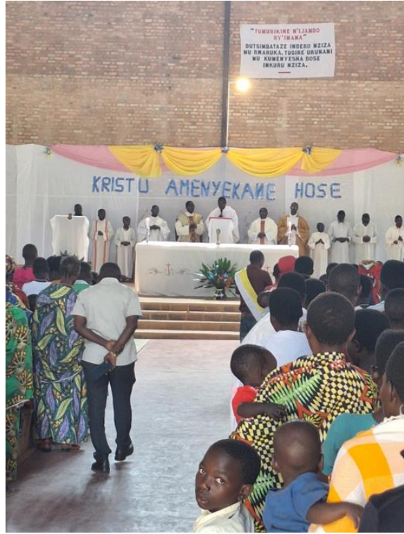
Het jongenskoor uit Bujumbura kwamen zingen in Busoro; ook de Diakenen waren erbij.