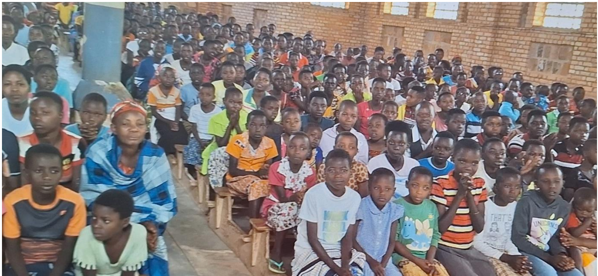
Het bijwonen van de Eucharistie viering in een volle katholieke kerk in Busoro.