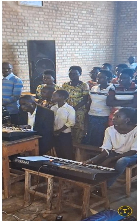
De hier gebruikte muziekinstrumenten waren geschonken door Morgenster