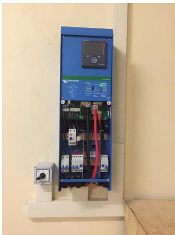
De omvormer-lader + zekeringen