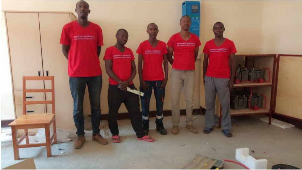
Ons vast team van ingehuurd technicians: zeer tevreden over de werkzaamheden en verblijf