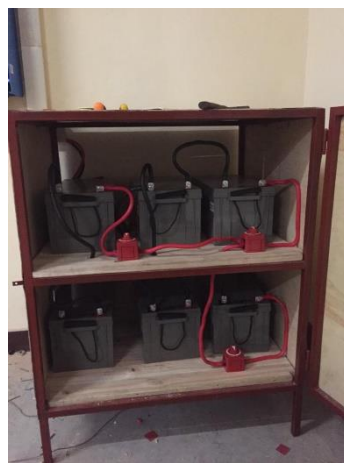
Zes accu's van 230 Ah