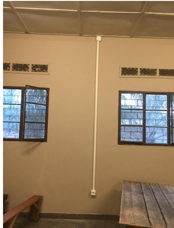
In elk lokaal verlichting en stopcontacten