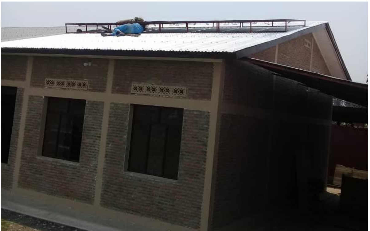
Plaatsing van kaders op het dak, montage en elektrische aansluiting van de solar panelen