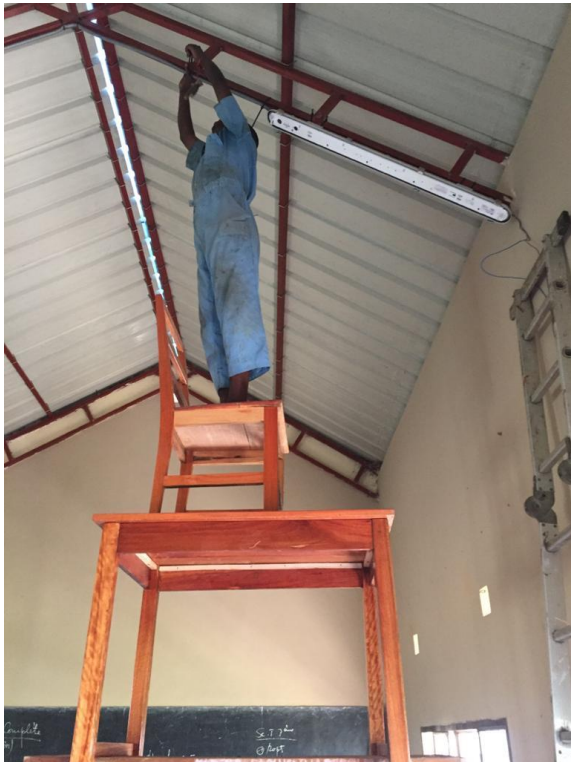
De beschikbare ladder was te kort!