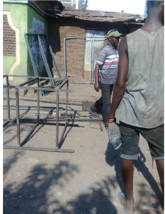
Lokale fabricage: het lassen en montage van stalen frames voor panelen en accukast