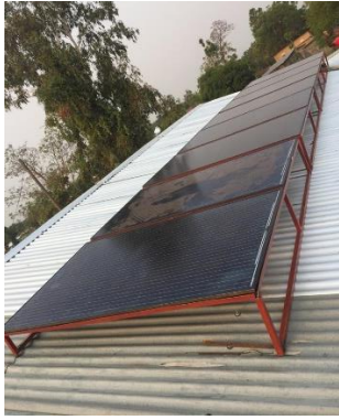
Klaar voor gebruik