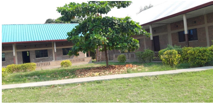
Een impressie van het complex met links een nieuwe vleugel