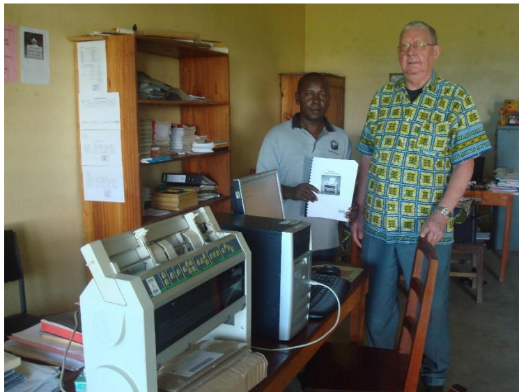
Speciaal te gebruiken folie om braille teksten erop aan te brengen, werd meegenomen naar het blindeninstituut in het dorp Gihanga in Burundi