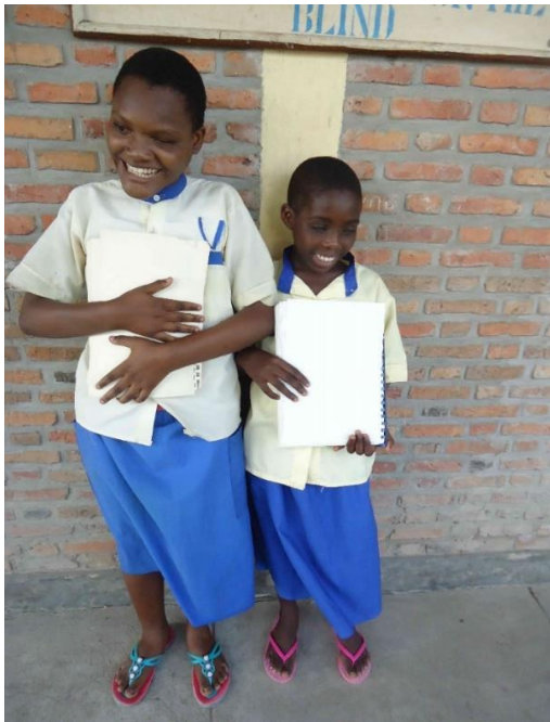
DEZE KINDEREN DRAGEN EEN SCHOOLUNIFORM