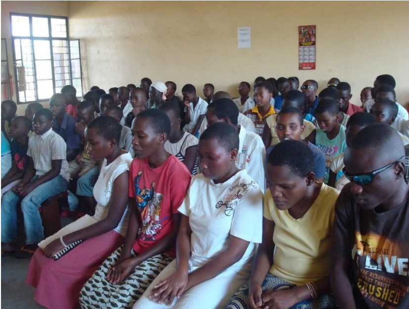
ONDERWIJS AAN JONGE VOLWASSENEN DIE BLIND ZIJN