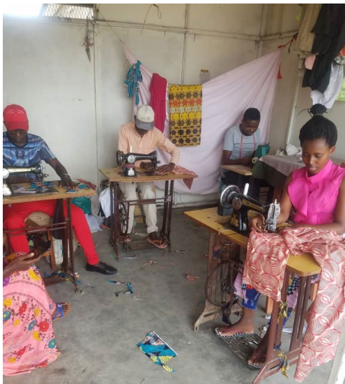
De start van een zelfstandig naaiatelier