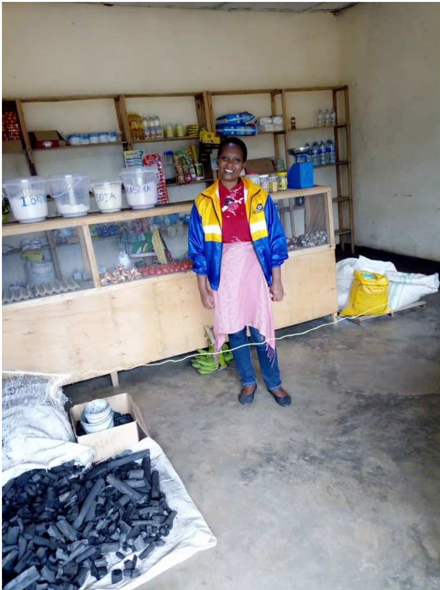
De eigenaresse van de boetiek is trots op de inrichting en toont haar verkoopartikelen