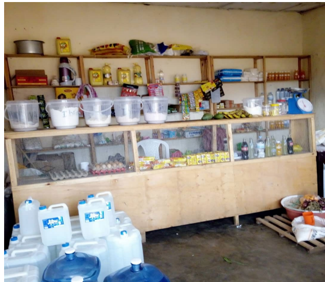
Financiering van de beginvoorraad van een boetiek