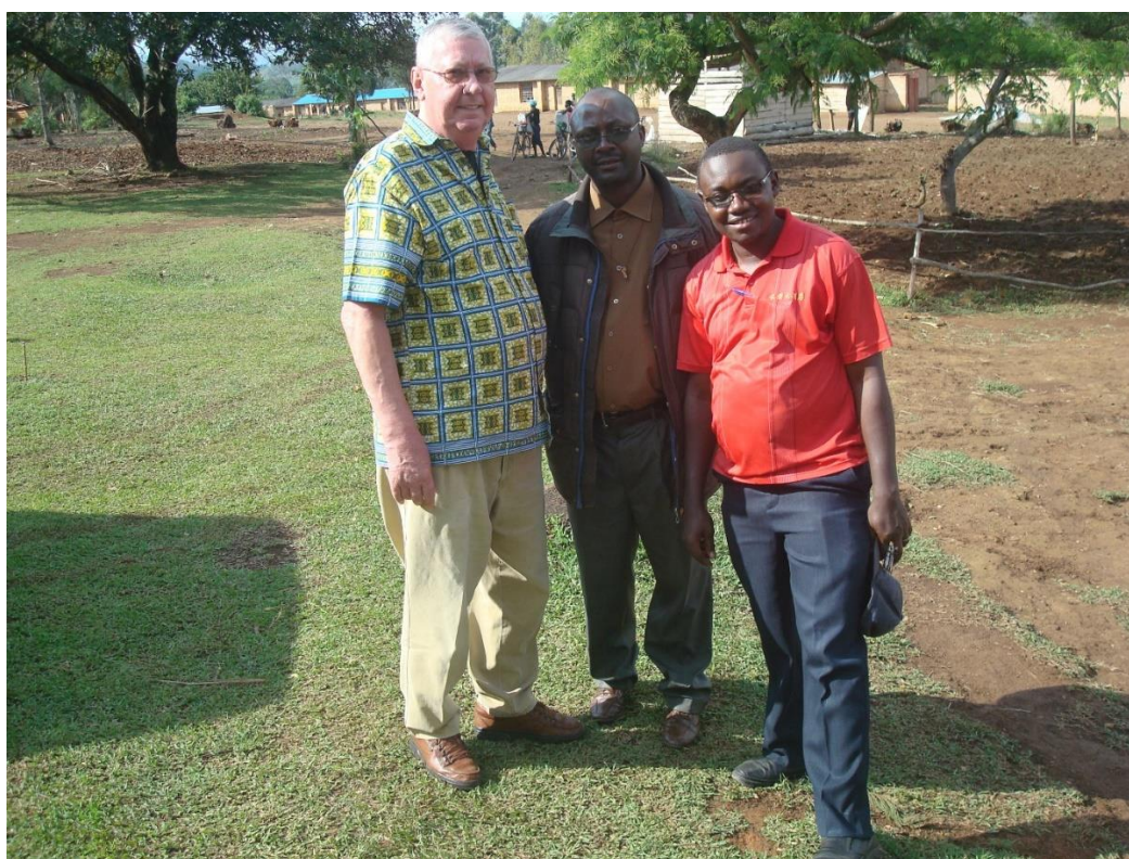
Het bestuur van de scholengemeenschap is zeer tevreden met het resultaat