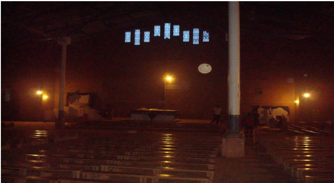
De gebedsdiensten op Kerstavond en Oudejaarsavond waren extra bijzonder met de aangebrachte verlichting