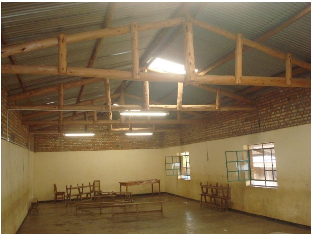
In elke bijeenkomst ruimte-ontspanningszaal zijn 5 LED TL buizen geplaatst