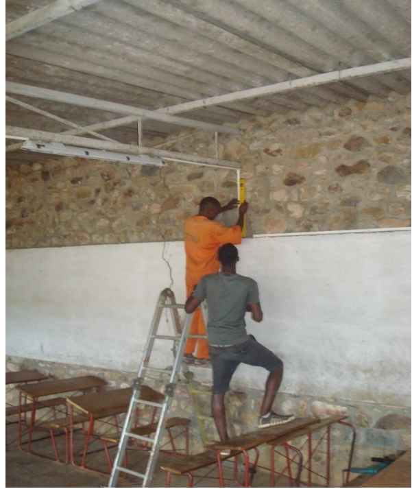
De werkzaamheden zijn begonnen