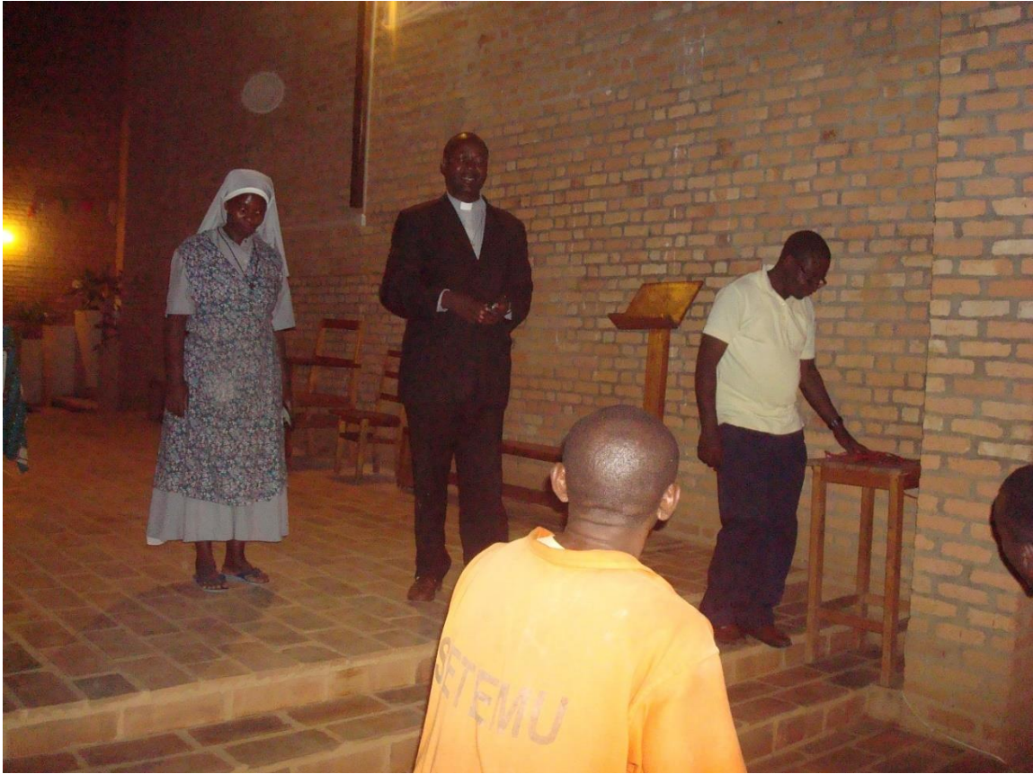
Met resterend materiaal werd als verrassing verlichting aangebracht in de kerk