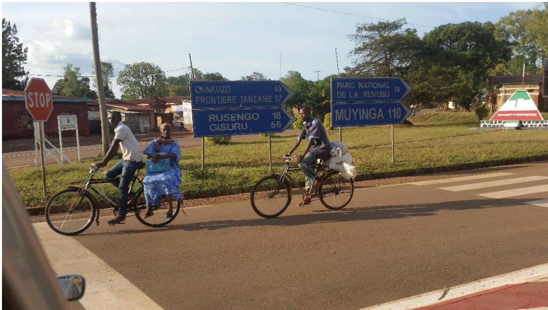
Onderweg naar Busoro richting Cankuzo (foto in Ruyigi genomen)

Project 2018-5: installatie van verlichting in klaslokalen, bijeenkomstzaaltjes, enkele kantoren, huisvesting en de kerk, middels zonne-energie met opslag in accu's in Busoro , in het oosten van Burundi.