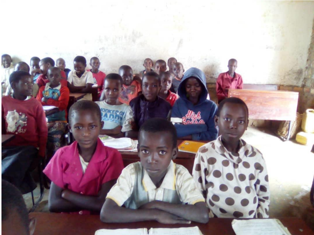
Ook in de klaslokalen is verlichting aangebracht voor avondstudie en huiswerk