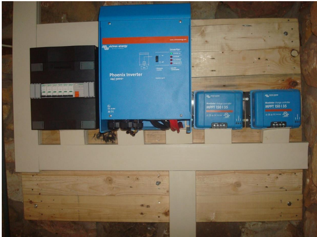
Details van de omvormer die elektriciteit uit de zonnepanelen omzet in 220 V