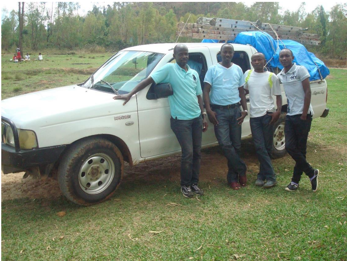
De technici met installatiematerialen en gereedschappen zijn gearriveerd