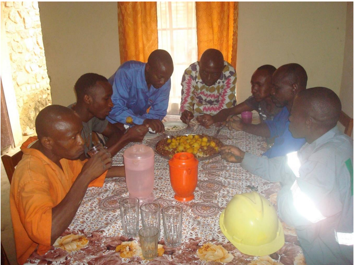
De middagmaaltijd van alle medewerkers aan het project