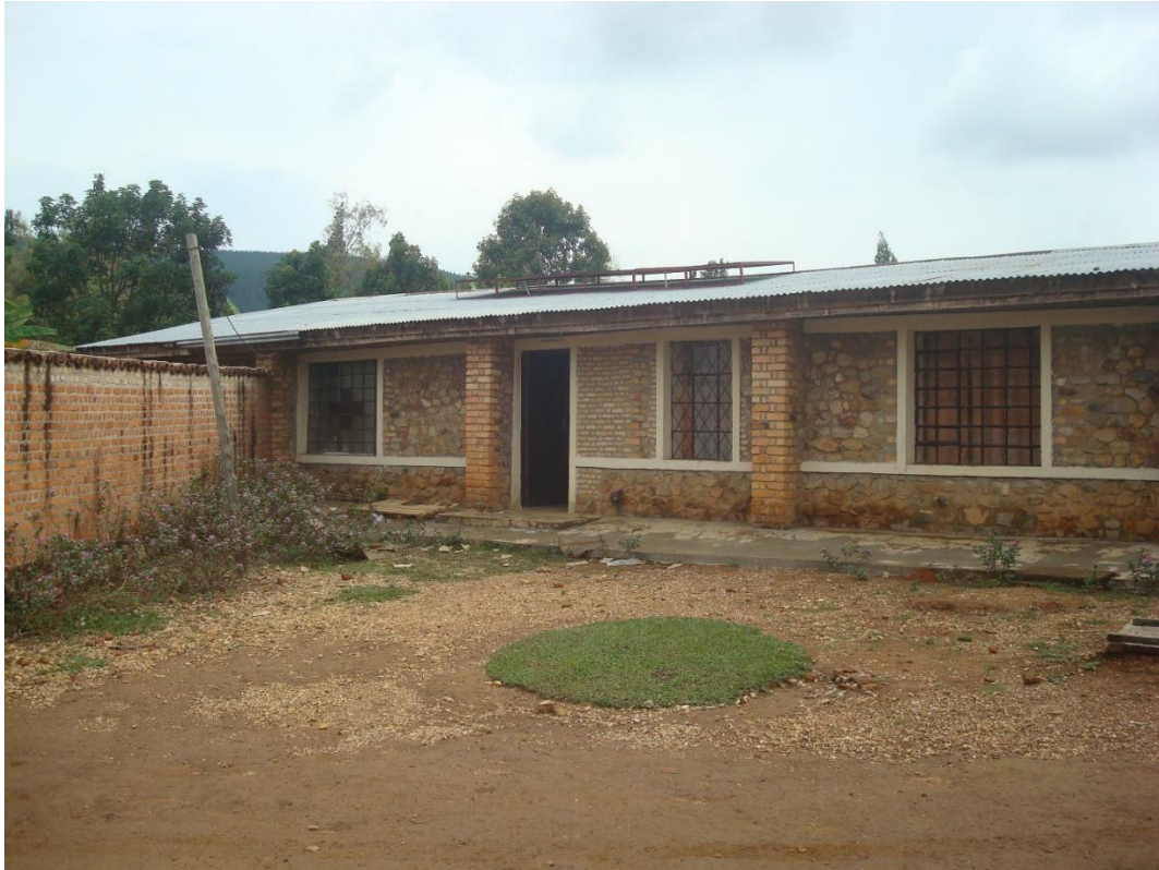
Een zestal fotovoltaïsche zonnepanelen worden verankerd boven het dak