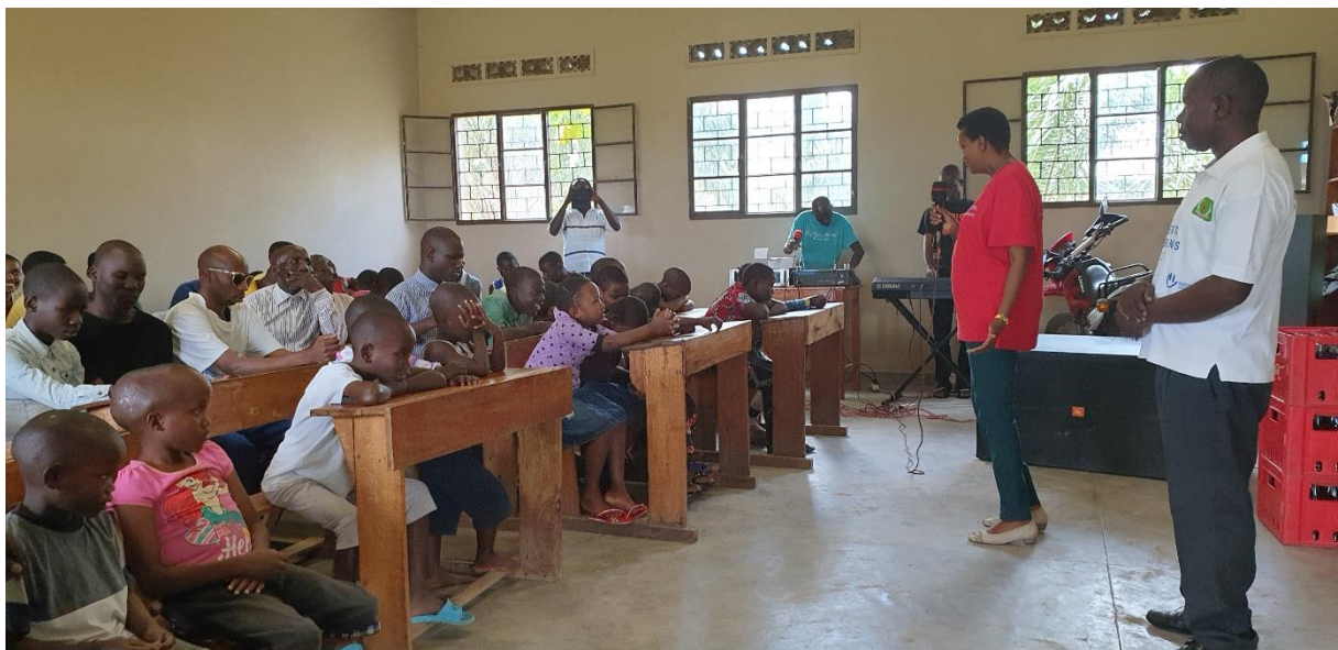
Een toespraak en gebed met alle leerlingen, gevolgd door een gezellig samenzijn.