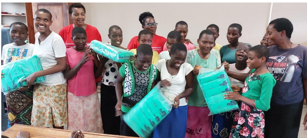
De opgroeiende meisjes zijn blij met de ontvangst van hygiënische benodigheden