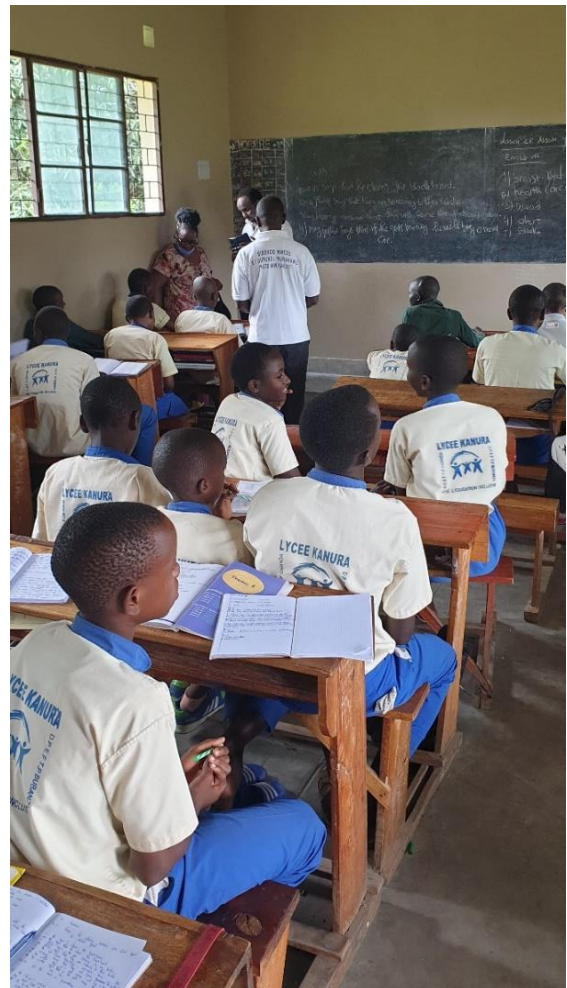
Een kijkje in de leslokalen; opleiding vanaf 1 ste jaar basis tot en met voortgezet tot 16 jaar