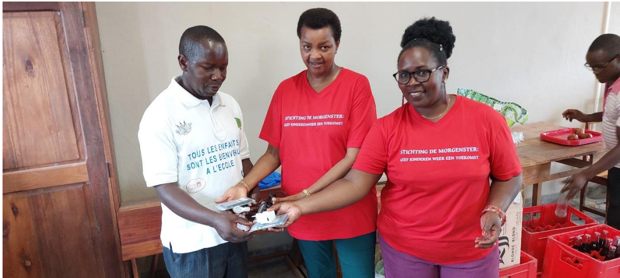
De Directeur van de school ontvangt enkele audiobijbels voor gebruik in de klassen.